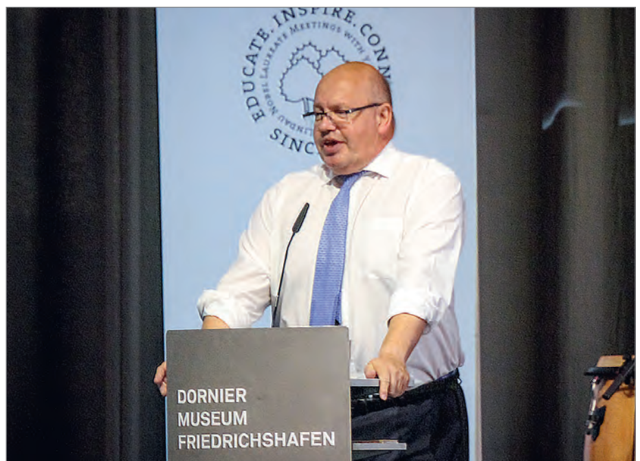
Peter Altmaier, Kanzleramtsminister, hielt die Festrede im Dornier-Museum.