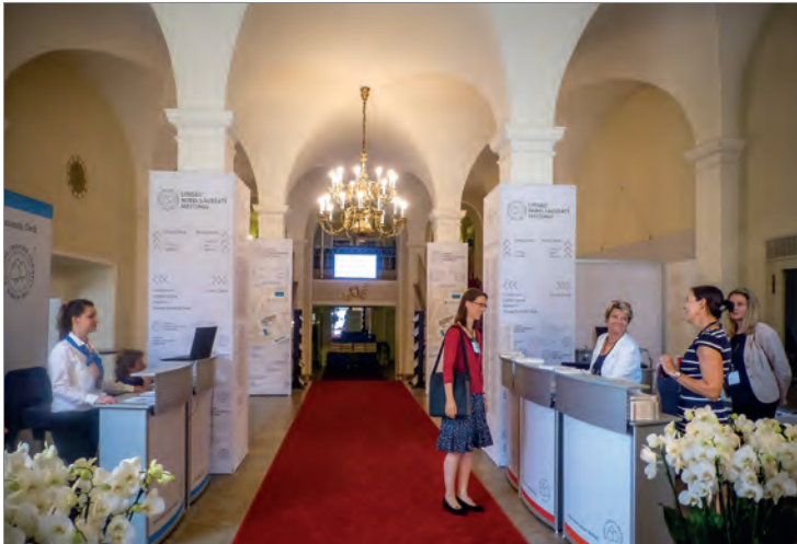
Das Stadttheater in Lindau bot dieses Jahr den Rahmen für die hochrangige Veranstaltung.

krieg erreichen. Die Nobelpreisträger sagten damals spontan zu und begründeten damit eine Tradition, die bis heute anhält.