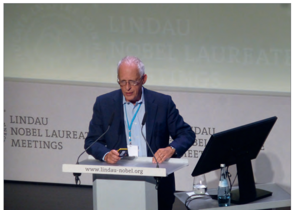
Am Podium standen die Wirtschaftsnobelpreisträger, hier Prof. Dr. Oliver Hart.

Die Treffen der Nobelpreisträger in Lindau haben bereits Tradition. So fand das jährliche Treffen der Nobelpreisträger der naturwissenschaftlichen Disziplinen in diesem Jahr bereits zum 67. Mal statt. Ausgangspunkt dieser Treffen war das Anliegen von Graf Lennart Bernadotte, Enkel des König Gustav V. von Schweden, ein Forum zu schaffen, das dem friedlichen Austausch der Wissenschaftler aus aller Welt dienen sollte. 1951 fand aufgrund seiner engen Beziehungen zum schwedischen Königshaus dieses Treffen erstmals in seiner Residenz auf der Insel Mainau statt. Man wollte eine Annäherung unter Wissenschaftlern nach dem Zweiten Welt-